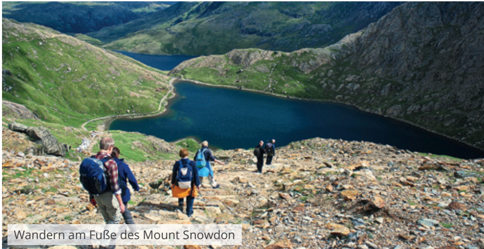
Wandern am Fuße des Mount Snowdon