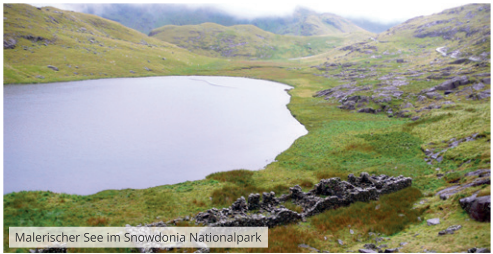
Malerischer See im Snowdonia Nationalpark