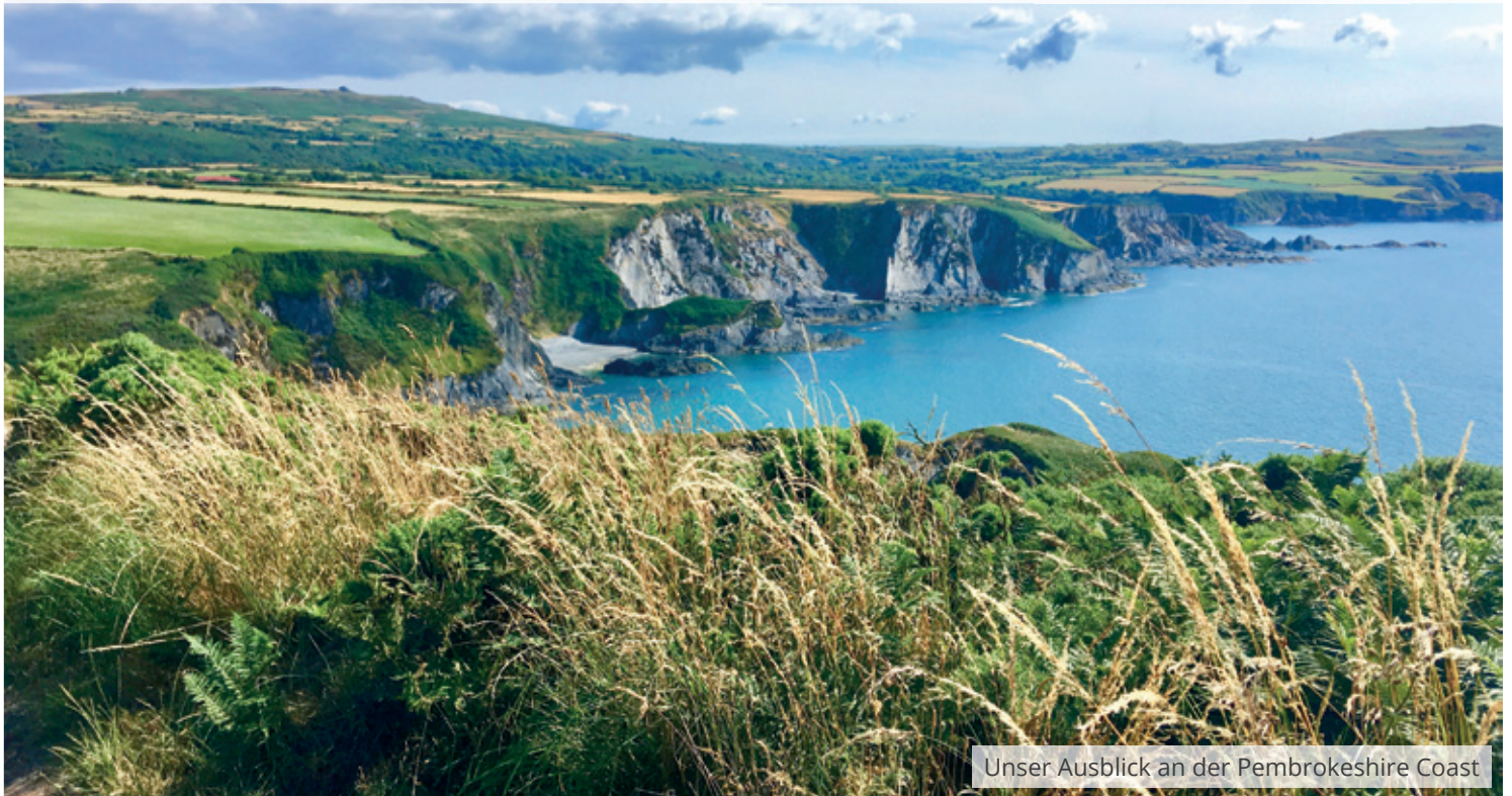
Unser Ausblick an der Pembrokeshire Coast